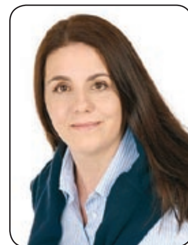
Presidente Barbara Degani

pi di cittadini e degli enti locali. Durante il periodo natalizio, in chiesa o in piazza, ogni paese ha il proprio presepe e la propria festa: un patrimonio che arricchisce di suggestione e fascino il nostro territorio e che l'Amministrazione provinciale vuole continuare a promuovere e sostenere. Il tutto raccolto in un ideale percorso che abbraccia arte, tradizione, fede e cultura immersi in un'atmosfera, come quella natalizia, che ben coniuga lo spirito di profonda spiritualità che anima il nostro territorio e la desiderio di stare in famiglia. E poi l'idea di un itinerario tra presepi e befane diventa anche una grande occasione per far conoscere un'arte ricca di valori e di storia. Con le festività che trovano il proprio epilogo durante l'Epifania e nel tradizionale falò della vecia, simbolo di un anno che se ne va e che lascia spazio a nuove speranze e nuovi orizzonti.